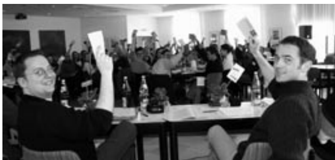
Die KLJB-Bundesversammlung 2004 beschließt den Antrag „Baustelle LAND – Agenda für die Zukunft ländlicher Räume“.

Dieser Beschlussfassung ist ein zweijähriger Diskussionsprozess