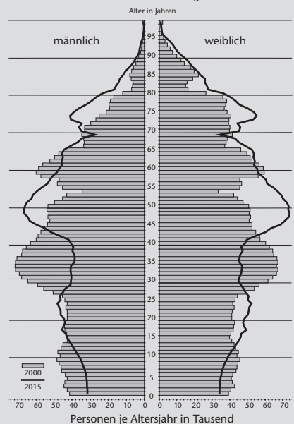
Bevölkerungsstruktur Niedersachsen 2000 und 2015 im Vergleich

Die Grafik zeigt exemplarisch die Bevölkerungsstruktur in Niedersachsen. In der gesamten Bundesrepublik ergibt sich ein ähnliches Bild.